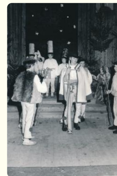
Koledy v podaní Kelčovancov v Rožnově pod Radhoštěm