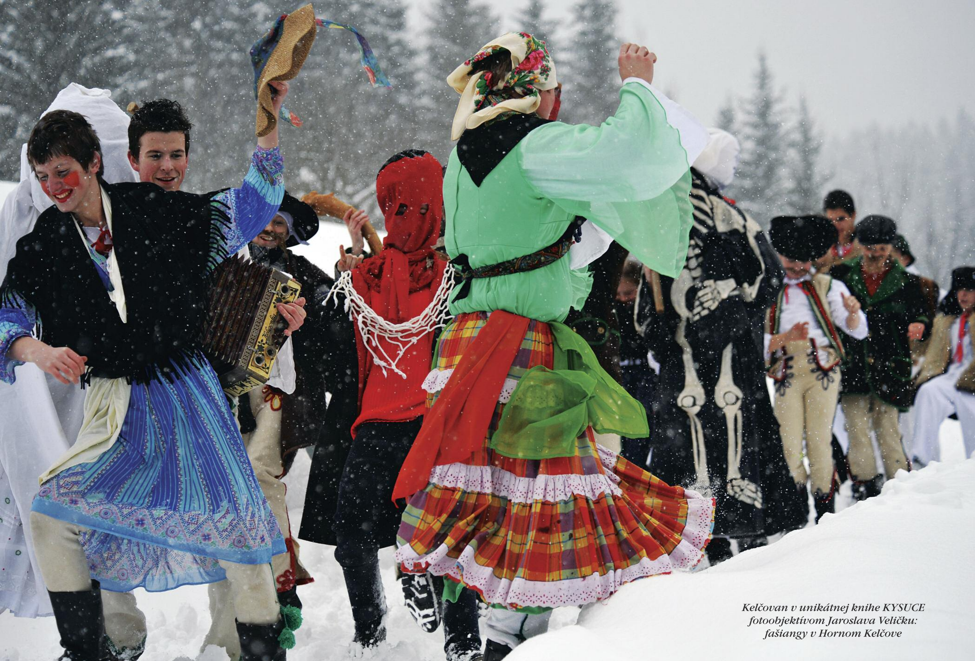
Kelčovan v unikátnej knihe KYSUCE fotoobjektívom Jaroslava Veličku: fašiangy v Hornom Kelčove