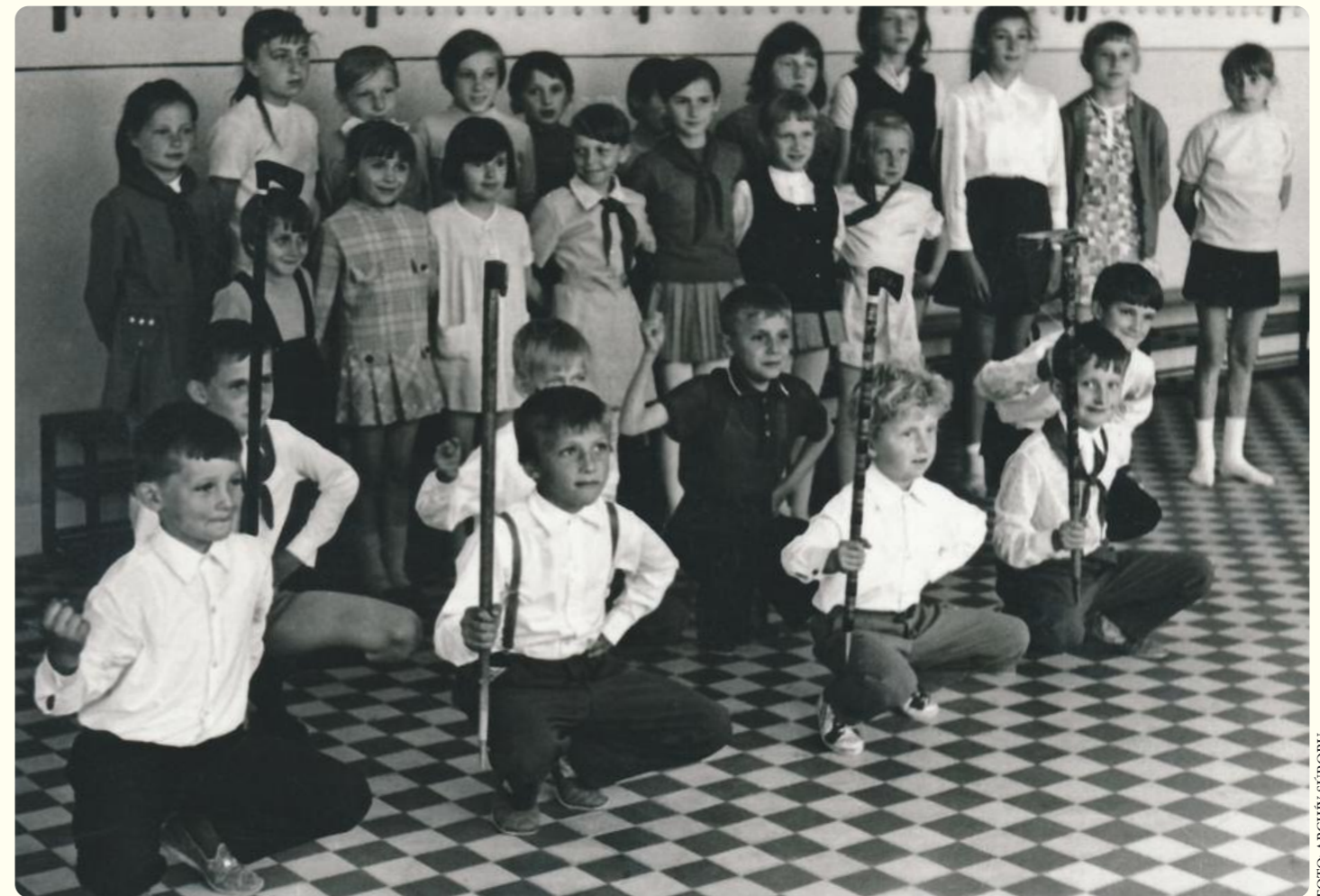
Zakladajúci členovia Kelčovanu