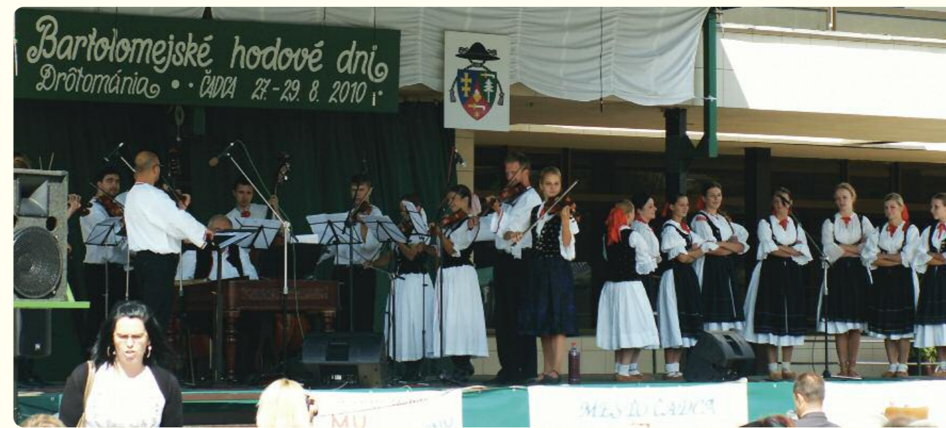
Čadca, Bartolomejský jarmok