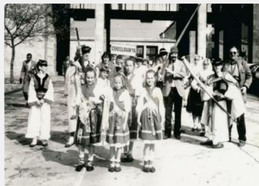
Turecko, Istanbul, 1990