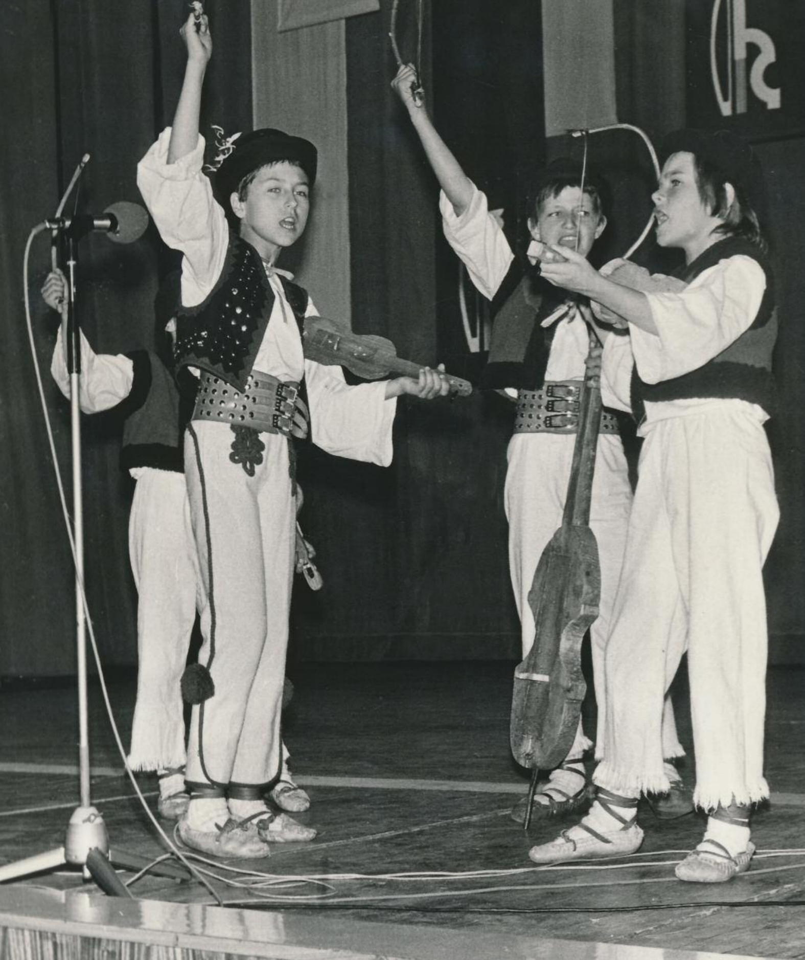
Vítazní muzikanti na celoslovenskej súťaži hudieb v Senci účinkujú na Bratislavských hudobných slávnostiach