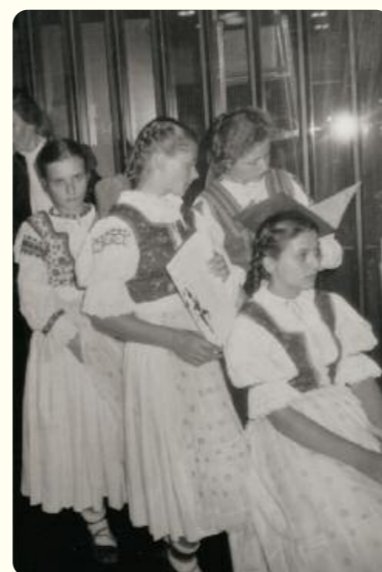
Pred vystúpením, Nórsko