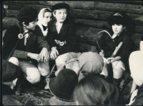
Z nakrúcania filmu: Čorňanski kuňoči