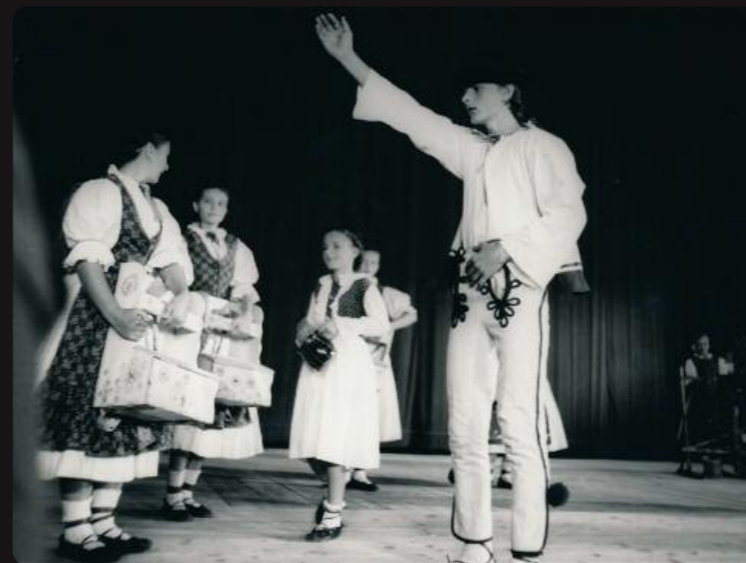
15. výročie Kelčovanu,