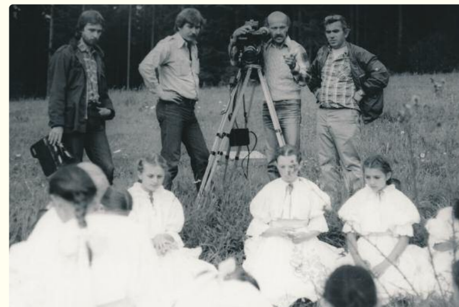
Filmovanie „Pri prameňoch krásy“, Vysoká nad Kysucou – Horný Keľčov