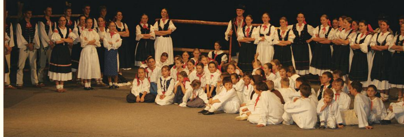
...30. výročie a 35. výročie Detského folklórneho súboru Kelčovan, Dom kultúry v Čadci