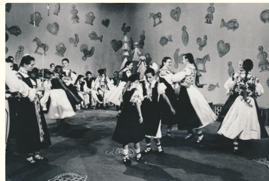
Filmovanie „Vonička z domova“, Brno