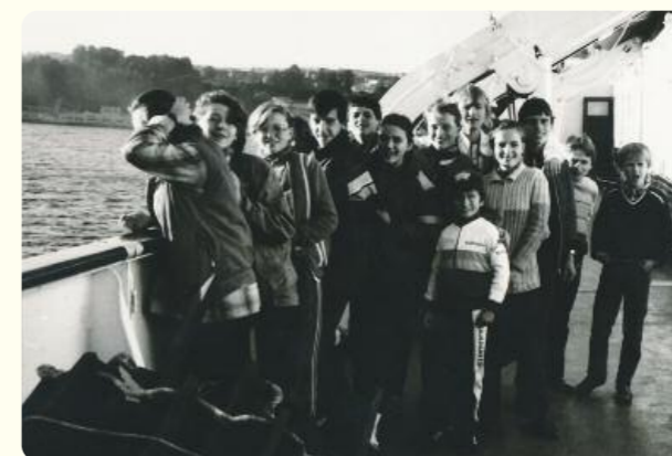
Cesta do Nórska